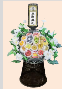
1基 ¥10,800(税込) 1基 ¥16,200(税込)