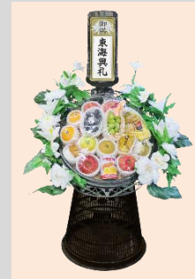
1基 ¥10,800(税込) 1基 ¥16,200(税込)